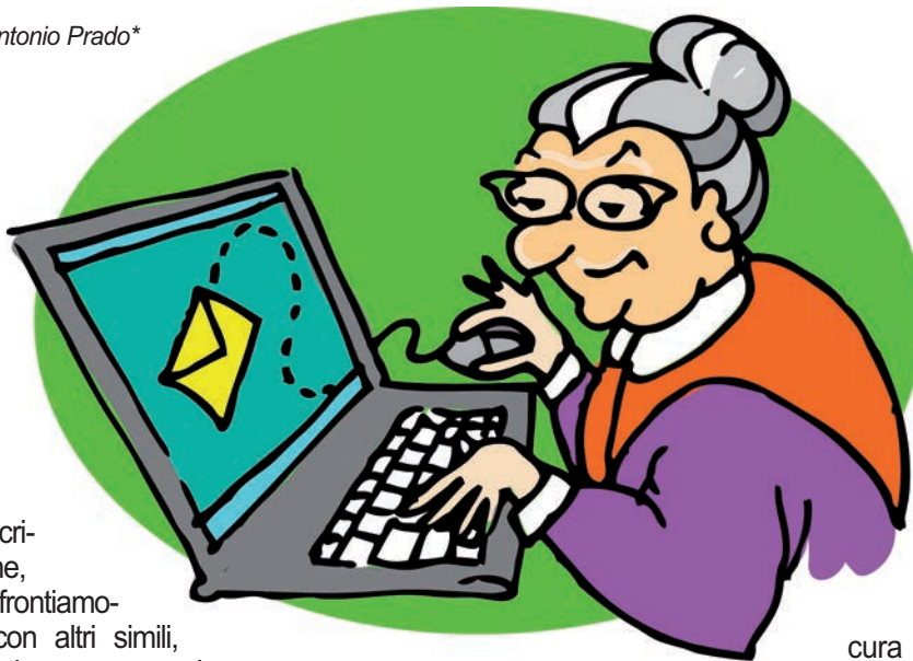
disegno di Belinda Menzietti

A ogni modo esiste anche la possibilità di trarre vantaggio da alcuni servizi di intermediazione nei pagamenti, come a esempio PayPal che, frazionandosi tra noi (o meglio la nostra banca) e il venditore, assi-